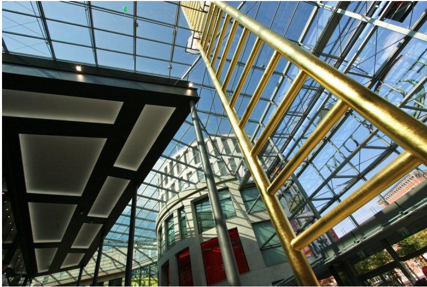
Die goldene Leiter in den Einkaufshimmel.